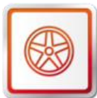
ORIGINÁLNE PRÍSLUŠENSTVO SEAT