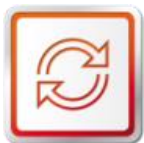
ORIGINÁLNE VÝMENNÉ DIELY SEAT