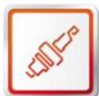
ORIGINÁLNE DIELY SEAT