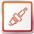
ORIGINÁLNE DIELY SEAT