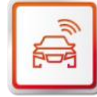
SEAT SERVICE MOBILITY