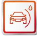
ZÁRUKA NA PREHRDZAVENIE Z VNÚTRA : ROKOV