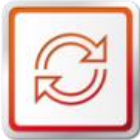
ORIGINÁLNE VÝMENNÉ DIELY SEAT