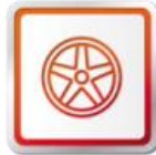
ORIGINÁLNE PRÍSLUŠENSTVO SEAT