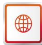
SIEŤ SERVISOV SEAT