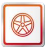
ORIGINÁLNE PRÍSLUŠENSTVO SEAT