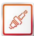
ORIGINÁLNE DIELY SEAT