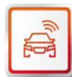
SEAT SERVICE MOBILITY