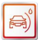
ZÁRUKA NA PREHRDZAVENIE Z VNÚTRA 12 ROKOV