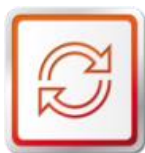
ORIGINÁLNE VÝMENNÉ DIELY SEAT