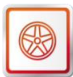
ORIGINÁLNE PRÍSLUŠENSTVO SEAT