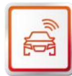
SEAT SERVICE MOBILITY