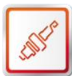
ORIGINÁLNE DIELY SEAT